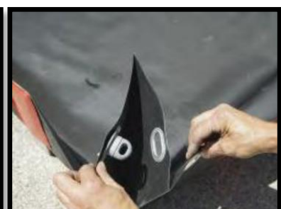
Encaixe para montagem